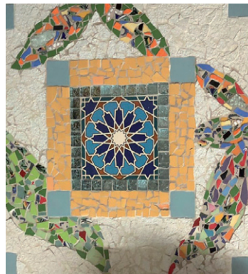
רני שרה יפרח