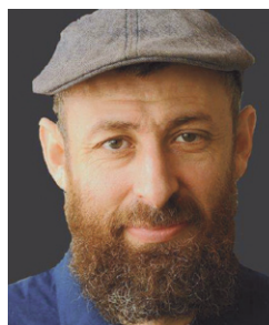
ויקטור אוחובסקי סטודיו לציור