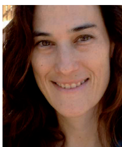
מרב באב"ד מעבדת איור